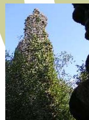
7. Ruïnes del castell de Molins. També anomenat torre d'en Buach, formava part dels dotze castells defensius de la vila de Llers, quan conformava el límit del comtat de Besalú.