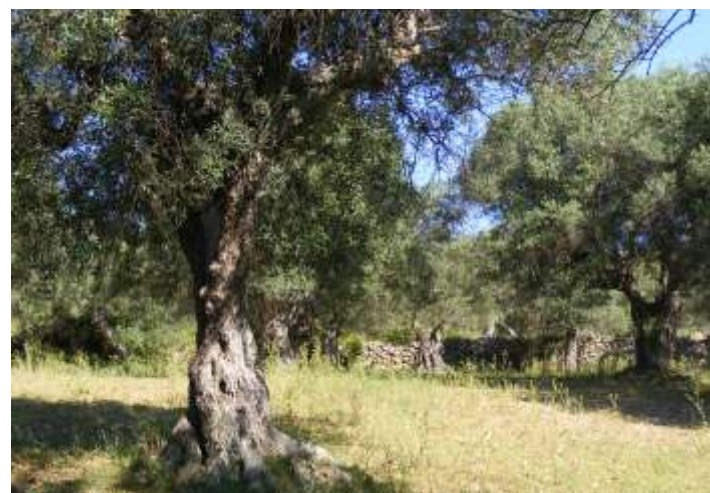
2. Olivars de la serra d'en Jordà. Es troben al llarg del camí que puja al santuari de la Mare de Déu del Roure. Són majoritàriament de la varietat picual, amb algunes de varietat culivell. Moltes tenen troncs centenaris, la majoria supervivents de "l'any de la fred" (1956).