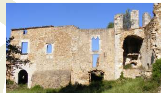
5. Monestir de Santa Maria del Roure. L'origen del conjunt de Santa Maria del Roure és una església romànica de la primera meitat del segle XII, relacionada amb el castell de Montmarí, amb una funció de torre de guaita avançada. A finals del segle XII s'instal·la l'ordre de Sant Agustí i, molt probablement, l'abat de Vilabertran (Lluís Berenguer, nascut a Llers i futur bisbe de Girona) funda el monestir. A començaments del segle XIV, el monestir es troba en un estat ruïnós pels assaltaments del comte d'Armanyac. El 1408 el Papa Benet XIII impulsa la reconstrucció del conjunt, que es fa seguint els canons de l'estil gòtic. El 1485 els Agustins són expulsats a causa de les guerres dels Remences. A principis del segle XVII es construeix l'església Nova i la Verge del Roure es converteix en la patrona de l'Empordà. A la segona meitat del segle XVII mor l'últim sacerdot que habitava al monestir. Durant les guerres contra els francesos (la guerra Gran, 1794), el monestir va servir de caserna a l'exèrcit espanyol i a causa de l'intercanvi de trets de canó amb els francesos, que ocupaven el castell de Mont-roig, el monestir va quedar destruït. El 1818 hi va haver un intent de reconstruir l'església Nova però va fracassar i el conjunt va quedar abandonat. Als anys vuitanta del segle XX es van fer treballs de consolidació a la façana principal i als arcs de l'església gòtica. Actualment, el monestir i el terreny del vessant oriental són propietat de l'Ajuntament de Pont de Molins.