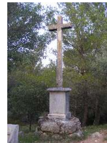
4. La Creu. Com explica la inscripció a la base, commemora la mort del "Generalísimo" de les tropes espanyoles, Luis Carvajal, en la cruenta batalla del Roure, dins de la guerra Gran o guerres de la Convenció (1794).