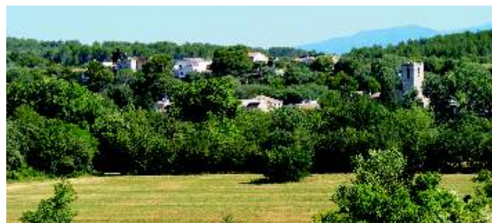
1. Barri de Molins. Nucli primitiu del poble de Pont de Molins. Amb documentació de nucli habitat des de segle XII (el Mas Joer). Durant varis segles va ser el coract u laboral, polític i econòmic de la població.