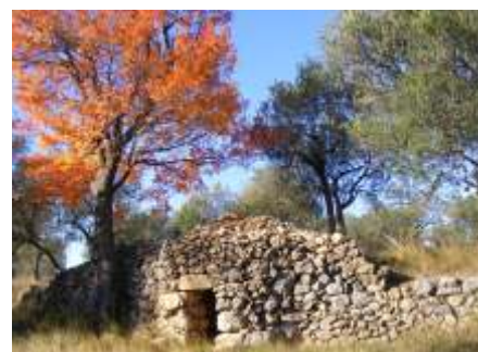
3. Barraques de pedra seca. Aquestes construccions són el patrimoni mut d'una època laboriosa, refugi de camperols, jornalers del camp i passavolants de tota mena. En aquesta zona són molt abundants, gairebé cada finca gran té la seva barraca.

Aquest itinerari és part del projecte de recuperació agro-forestal i social de la Muntanya del Roure, finançat per l'Obra Social de la Caixa i la Diputació de Girona. Aquest projecte ha permès la recuperació de murs de pedra seca, la millora forestal dels voltants del monestir del Roure, la creació d'una bassa per la fauna i l'obertura d'un camí abandonat, que ha possibilitat l'itinerari circular que us presentem.