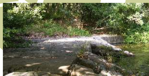
6. Pont del Molí d'en Jordà. Aquest pont va ser el pas per creuar la Muga en el camí de Pont de Molins a Les Escaules, abans que existís l'actual carretera comarcal. Construït a l'Alta Edat Mitjana, ha sofert nombroses modificacions a causa dels desperfectes de "les mugades" (avingudes de la Muga) fins a arribar als nostres dies.